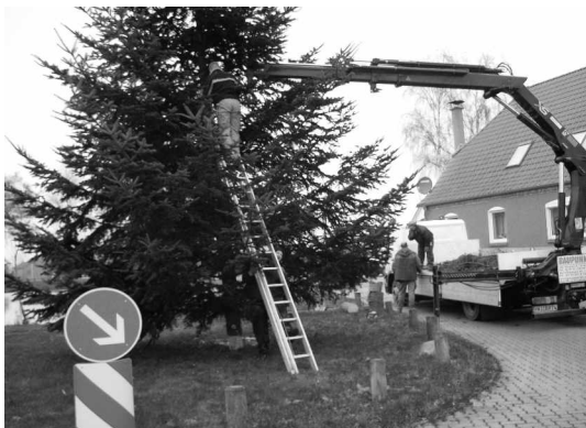
Beim Aufstellen der Tanne werden fleißige Hände und schwere Technik gebraucht