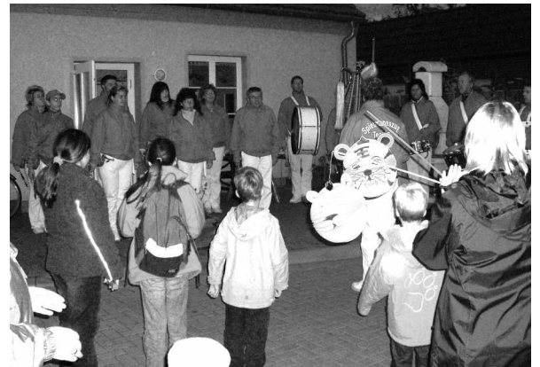
Der Spielmannszug Tessin begeisterte nicht nur die Jüngsten