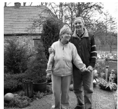
Der Bauer und seine Bäuerin in ihrem Blumengarten

Die politische Wende 1989 ermöglichte es, wieder Herr auf eigener Scholle zu sein. Jetzt bewirtschaften wir 200 ha Land. 50 Prozent sind für Marktfrucht, das sind vorwiegend Getreide und Zuckerrüben, und die andere Hälfte gehört der Milch- und Fleischproduktion. Die Bedingungen sind nicht einfach. Eine Chance hat nur der, der auf dem neuesten Stand bleibt.“ Deshalb wurde für die Milchviehanlage ein neuer Stall samt Melkanlage gebaut und in moderne Landtechnik investiert.