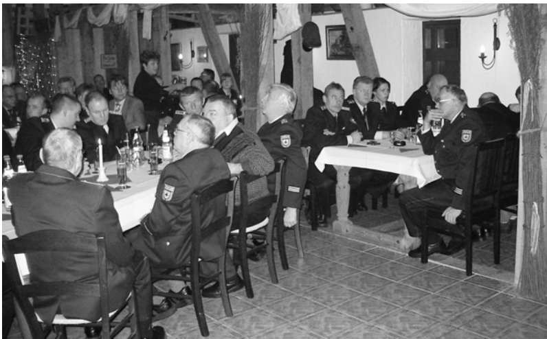
Die Kameraden der Freiwilligen Feuerwehr sind in ihrem Ehrenamt zu jeder Zeit eine große Stütze für die Sicherheit in der Gemeinde

Gebe es sie nicht, würde Vieles nicht funktionieren. Ob in den Gemeinden, in Sportvereinen, Schulen oder der Freiwilligen Feuerwehr. Sie – das sind Frauen, Männer und Jugendliche, die ehrenamtlichen Aufgaben im Alltag wahrnehmen und erfüllen. Auch in unserem Dorf sind sie unterwegs, opfern ihre Freizeit, um zu helfen, für das Gemeinwohl etwas zu Wege zu bringen.