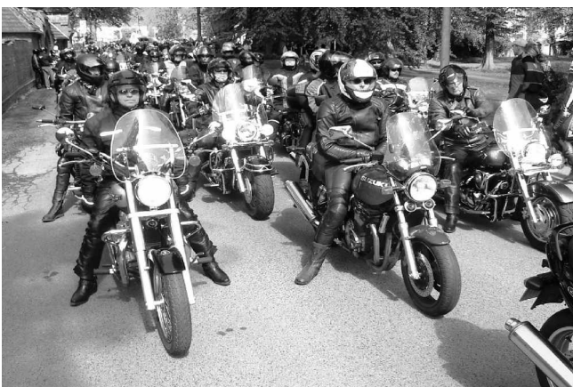
Aufstellung beim Doberaner Bikertreffen, gleich geht's los

eine Woche von einem Ferienhaus schöne Touren an der Cote d'Azur und in das Hinterland der Provence unternommen werden können. Auf ihrer Internetseite können Sie mehr erfahren und vor allem sehen unter www.bikerfreunde.bargeshagen.de.vu . Was aus der Internetseite nicht hervorgeht, weil es keinen direkten Zusammenhang gibt, ein Teil der Bikerfreunde trifft sich wöchentlich mit weiteren Freunden aus der Gemeinde in der Feuerwehr, um als Linedance-Truppe zu üben und aufzutreten, so auch auf dem Sommerfest im vergangenen Jahr. Übrigens: Biker mit Interesse an gemeinsamen Ausfahrten und Austausch von Informationen sind herzlich in diesem Kreis willkommen. Meldet Euch unter 0160 7039392 oder über die angegebene Internetseite.