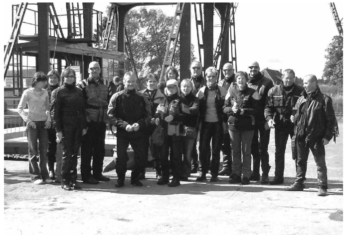
Auf der Fahrt ins Alte Land

Unter den Teilnehmern am Doberaner Bikergottesdienst finden wir jährlich auch ein starkes Team von PS-Begeisterten aus unserer Gemeinde. Wenn, wie in diesem Jahr, 11000 Fans der dröhnenden „Mopeds“, zum Bikergottesdienst in das Doberaner Münster gerufen werden, hat für die „Bikerfreunde Bargeshagen“ die Saison längst begonnen. Sobald im April das Wetter und die meist zeitlich begrenzte Zulassung es schon gestatten, werden die auf Hochglanz polierten Maschinen aus der Garage geholt, und es werden die Motoren gestartet. Oftmals ist die erste Ausfahrt wegen der Kälte nur ganz kurz, aber das Verlangen nach der Winterszeit ist oft schon größer, als die Abschreckung der gefühlten Temperaturen. Im Internet kann man lesen „Wir sind Leute, die in ihrer Freizeit gerne und vor allem gemeinsam Motorrad fahren. Unser Hobby soll auch Hobby bleiben, damit der Spaß nicht zu kurz kommt. Wir sind männliche sowie auch weibliche Biker zwischen 25 und 57 Jahre