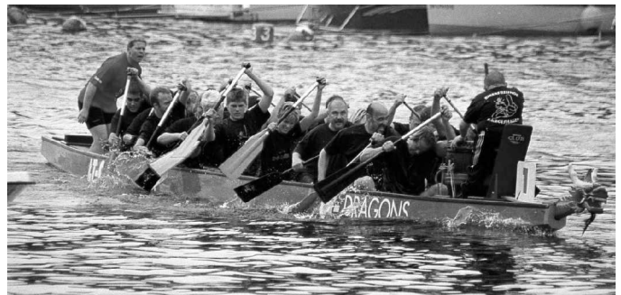
Die Drachenboot-Crew 2006

km stillgelegt, denn es geht mit dem Autozug von Hamburg nach Lössen. Von dort wird über die Alpen an die Mittelmeerküste gefahren. Die Ehefrauen werden am 11.09. mit dem Flieger nachkommen, damit gemeinsam