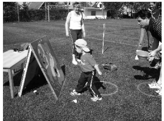
Beim Ballzielwurf auf einer Minitorwand hatten die Kinder die Nase gegenüber den Erwachsenen