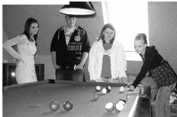
Billard macht Spaß und übt Konzentration

Bitten und Drängen der Jugendlichen wurden zwei der unteren Aufenthaltsräume zu einem großen Raum umgebaut.