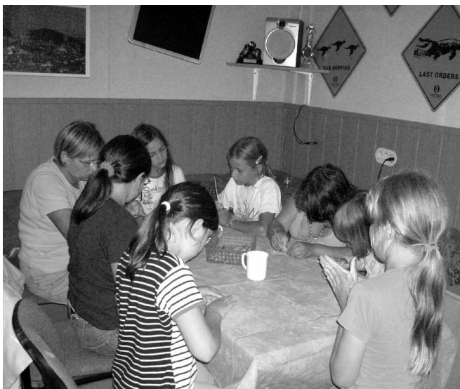
Die Jüngsten töpfern konzentriert an ihren kleinen Kunstwerken