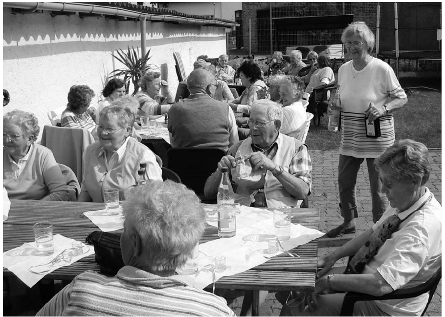
Die BRH-Mitglieder bei ihrer Rast im Jugendtreff Admannshagen