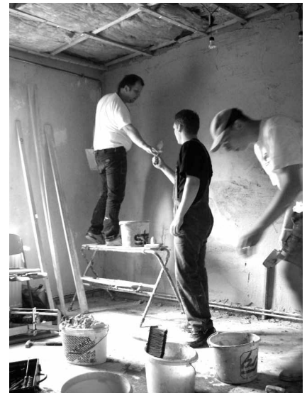
Gemeinsam gelingt die Arbeit besser

Am 22. April fiel der Startschuss. Schnell haben wir erkannt, dass diese Aktion eine große Herausforderung unseres Klublebens ist, denn durch die alte Bausubstanz wurden wir anfangs vor große Probleme gestellt. Durch schnelle Entscheidungen in Zusammenarbeit mit dem Bürgermeister, zuständigen Institutionen und hilfsbereiten Vätern konnten wir diese schnell bewältigen. Alle sind emsig bei der Sache, sei es nach der Schule oder nach der Arbeit. Sie setzen zielstrebig ihre Kräfte und Ideen in die Tat um. Wände wurden eingerissen, Stützbalken gesetzt, Tapeten entfernt, tapeziert, eine neue Decke eingezogen, Holzarbeiten erledigt und ein Teil der Wände mit Gipskartonplatten verkleidet und verputzt. Wir se-