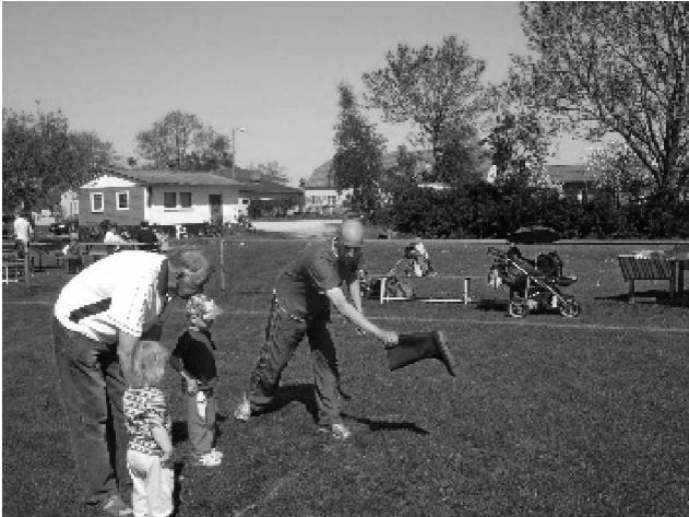
Stiefelweitwurf ist nicht nur in Ostfriesland bekannt. Wie bereits 2007 flogen auch in diesem Jahr die Stiefel durch die Luft.

Sport macht Spaß. Dieses Motto stand im Mittelpunkt des 3. Familiensportfestes, zu dem die AWO-Kindertagesstätte „Storchennest“ in Bargeshagen eingeladen hatte. 42 Mädchen und Jungen kamen, mit ihnen Eltern und Großeltern. Gemeinsam gingen sie an acht Stationen an den Start ob zum Zielwerfen, Eierlauf oder Sackhüpfen. Beson-