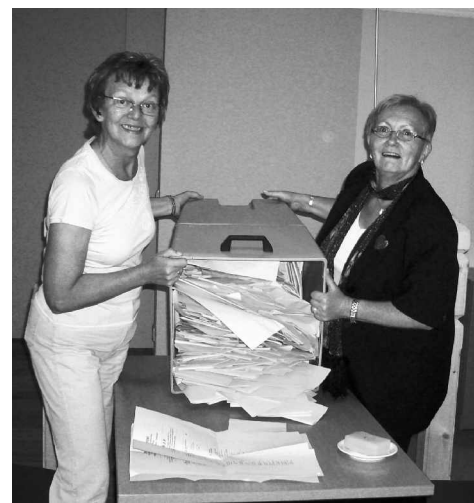
Die Wahlurne ist geöffnet, nun beginnt das Entfalten, Sortieren und Auszählen