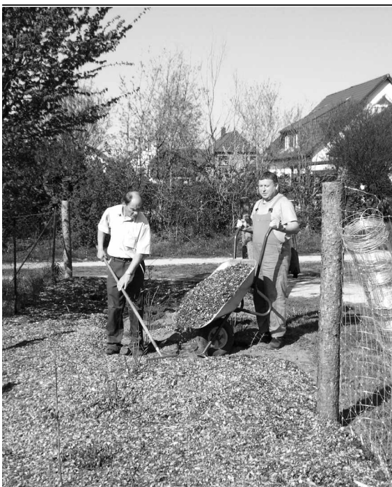
Die Pflege kommunaler Anlagen durch die Gemeindeglieder soll das Bild unseres Dorfes noch ansprechender machen. So wurde der Gemeindegarten hinter dem Autohaus Westendorf bereinigt und ein Schutzzaun gesetzt.

Den vöriigten Maand, dor stellt sick dat rut, wur düer mi to stahn kümmt mien rode Snuut: De Hälft, de Hälft von all, wat ick bruuk, flütt in mienen Buuk! Is dat woll to glööben? Potz Kohlsupp un Röben, nee, dat geht to wiet! Dat's denn doch mihr, as ick verknusen kann! Un siet dee Tiet – Dor schriew ick't nu nich mihr an.