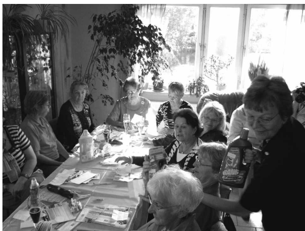
Reges Interesse bei der Vorführung der Waschmittel

Waschtag war noch vor 50 Jahren eine aufwendige Prozedur. In der Waschkü- che wurde ein großer Kessel angeheizt und die Weißwäsche gekocht. Mit viel Kraftaufwand wurden Bettzeug, Hand- tücher und Bekleidung auf einem