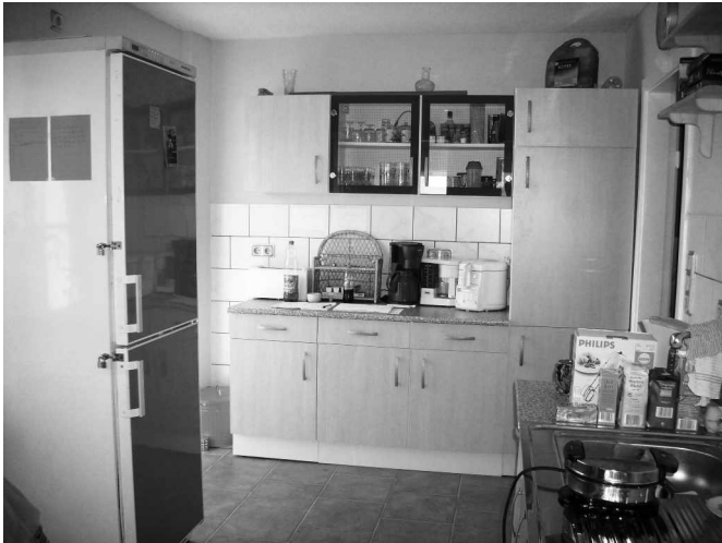
Einer guten Küche fehlt's nie an Freunden, in diesem Sprichwort steckt viel Wahrheit

Der Jugendclub Creativ Center an der Hauptstraße in Bargeshagen entwickelt sich immer mehr zu einem Schmuckstück. Doch das nicht von allein, sondern mit Fleiß und Einsatz der dort anwesenden Jugendlichen. Der Club wird für Freizeitbeschäftigungen wie Dart, Billard, Töpferei, Computerspiele oder auch zum Erledigen von Schulaufgaben montags bis freitags zwischen 16 und 20 Uhr von bis zu 20 Jugendlichen unter Anleitung der Betreuerin Frau Uta Facklam genutzt. Und da spielen und lernen bekanntlich auch hungrig macht, diente bisher ein kleiner Raum als Küche. Aber auch kleine Veranstaltungen werden durch die Jugendlichen vorbereitet, durchgeführt und zusätzlich auch mal Gäste bewirtet, wie die jungen Fußballer des 1. FC Obotrit. Oft erwies sich diese Küche als zu klein, und auch das Ambiente war aus vielen abgelegten Möbeln zusammengestellt.