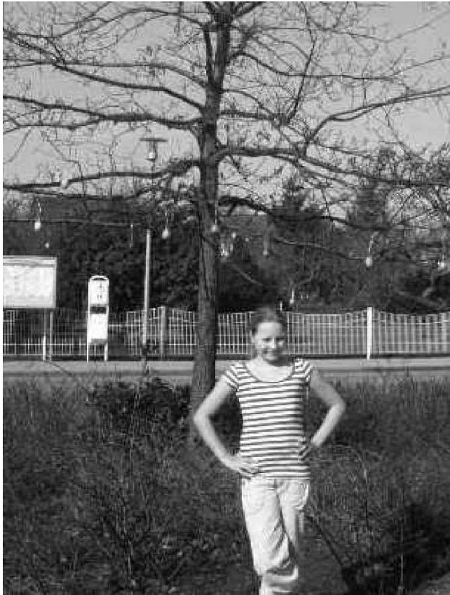
Der Ostereierbaum an der Buswendeschleife

...und er kommt nicht allein, denn auch der Frühling mit seinen ersten Sonnenstrahlen konnte unserem Jugendtreff wieder eine frische sommerliche Brise mit vielen neuen Ideen einhauchen.