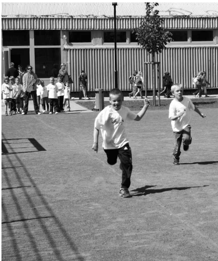
Die schnellsten Läufer kamen sowohl bei den Jungen als auch bei den Mädchen aus dem „Storchennest“ Bargeshagen

Bereits im vergangenen Jahr konnten die damaligen „Storchennest-Vorschulkinder“ den Wanderpokal der sportlichsten Kita erstmals mit nach Bargeshagen nehmen. Nun galt es natürlich, den Pokal zu verteidigen und ihn dieses Jahr nicht an eine andere AWO-Kita abgeben zu müssen.