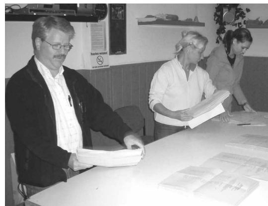
Das Prüfen und Sortieren der Wahlzettel erforderte auch in Admannshagen hohe Konzentration