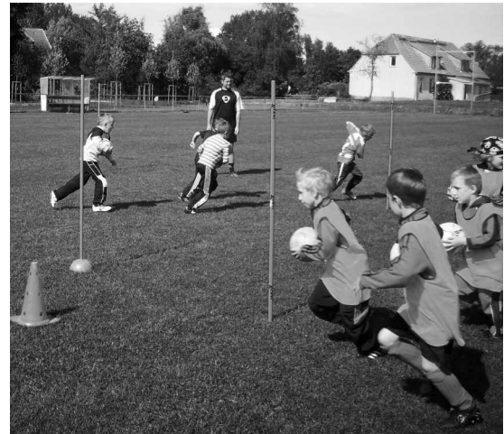
Training als Wettkampf zwischen zwei Mannschaften macht Spaß und fördert die Kondition und den Ehrgeiz

Hallo liebe kleinen und großen Gemeindebewohner, heute wollen wir, die Jüngsten des 1. FC Obotrit, uns einmal zu Wort melden. Vor ca. 2,5 Jahren haben wir als kleine Sportgruppe mit Ballspielen angefangen. Heute sind wir schon eine richtige Fußballmannschaft der 5-7jährigen und nehmen regelmäßig an Punktspielen teil. Derzeit läuft es ganz gut für uns. Momentan stehen wir kurz vorm Saisonende auf dem zweiten Tabellenplatz. Im Winter haben wir sogar den Titel „Hallenkreismeister“ errungen. Darauf sind wir mächtig stolz.