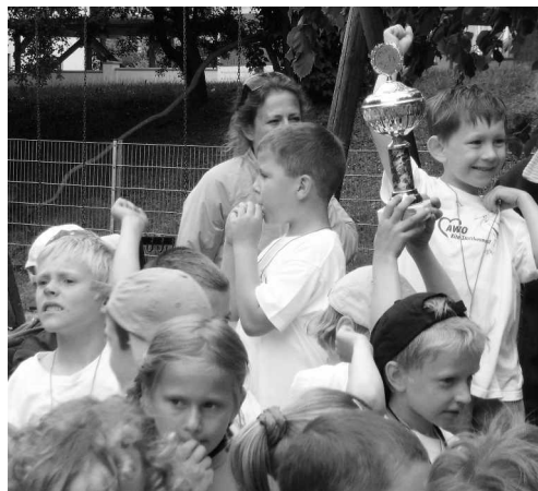
Juchu, zum zweiten Mal in Folge „Pokalsieger“